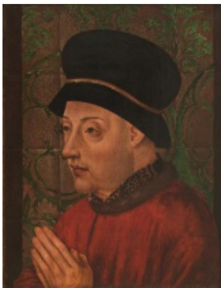
Museu Nacional de Arte Antiga Pintura - Retrato do Rei D. João I 1434 - 1450

Foi pai de D. Duarte, D. Pedro e D. Henrique, irmãos da chamada inclita geração, que muito deram ao reino de Portugal.