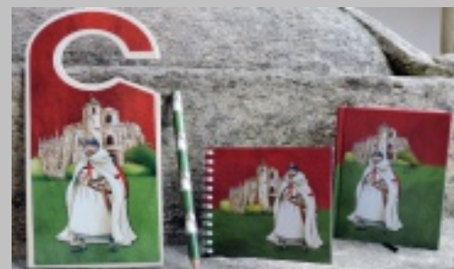
Linha juvenil de papelaria Gualdim Pais