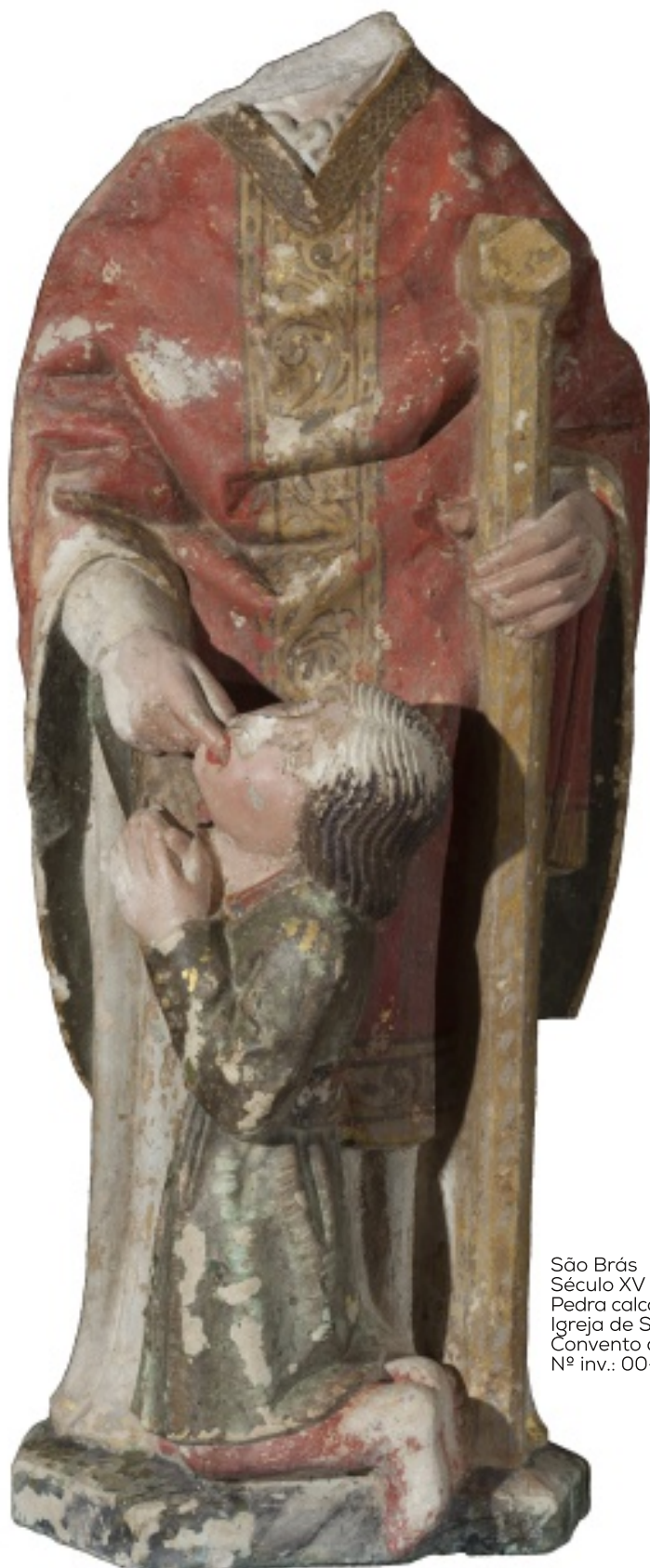
São Brás Século XV Pedra calcária policromada Igreja de S. Pedro, Tomar Convento de Cristo, Tomar Nº inv.: 00-ESC-13