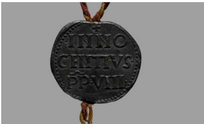
Selo do Papa Inocêncio VIII, chumbo (?).

Se procura o presente ideal para o Dia dos Namorados, visite a nossa loja onde poderá encontrar livros, jogos, jóias, peças em cerâmica, T-shirts e artigos de papelaria entre outros.